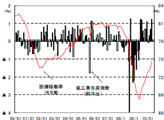
(図表1) 鉱工業生産と稼働率の推移(月別)

一方、設備稼働率は 74.7%と前月(73.7%)から 1%ポイント上昇、昨年6月(68.3%)をボトムに 11ヵ月連続で上昇し、2008年10月(75.4%)以来の水準を回復した。前年比では 6.2%ポイントの上昇となる。なお、長期的な平均稼働率水準(1972～2009年の平均)は 80.6%(リセッション入り時の2007年12月も同値)であり、依然、5.9%ポイント下回っている。