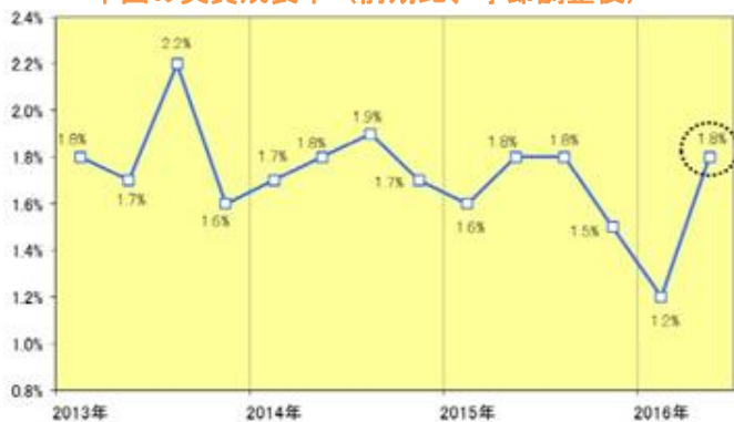
中国の実質成長率（前期比、季節調整後）

1 2016年上期（1-6月期）の中国経済を振り返ると、1-3月期には景気が下振れしたものの、4-6月期にはやや持ち直すこととなった。4-6月期の実質GDP成長率は前年同期比6.7%増と市場の事前予想（同6.6%増）を上回る結果となり、前期比では1.8%増（年率換算すれば7.4%前後）と2016年の成長率目標（6.5-7%）を上回る伸びを回復、工業生産者出荷価格の下落ピッチが鈍化して“名実逆転”は解消、デフレ圧力はやや緩和した。