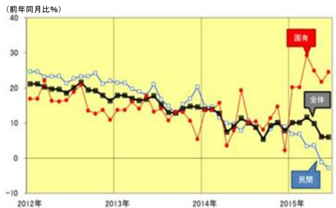
固定資産投資（国有と民間）の推移

(注)累計で公表されるデータを元に推定、1・2月は共に2月時点累計(前年同期比)