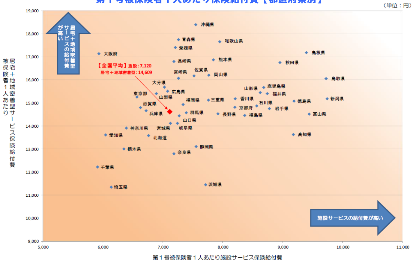
第1号被保険者1人あたり保険給付費【都道府県別】

（特定入所者介護（介護予防）サービス費は、国民健康保険団体連合会から提出される現物給付分のデータと保険者から提出される償還給付分のデータを合算して算出した値である）